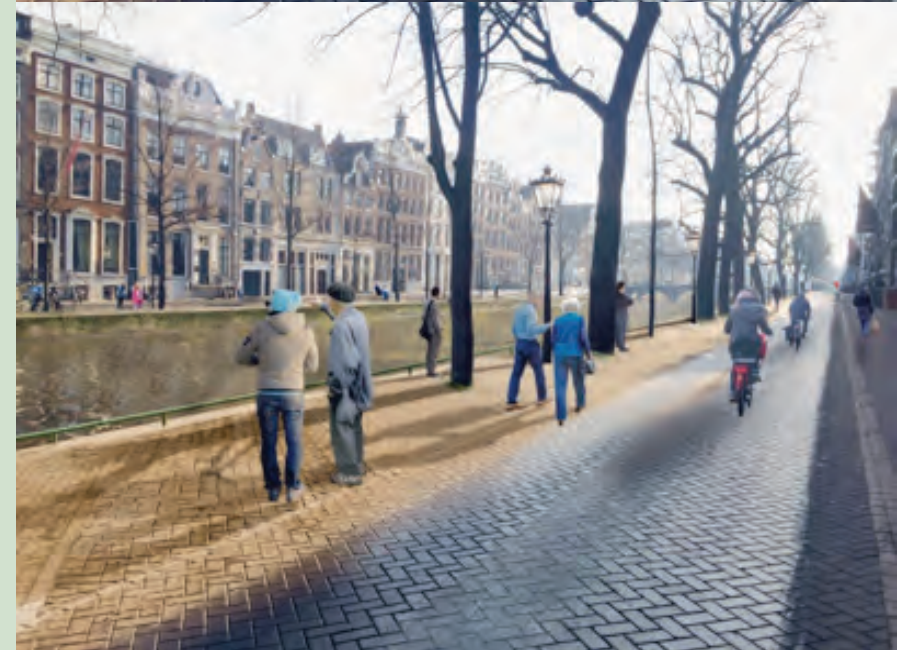
Prettig lopen en fietsen op de Keizersgracht