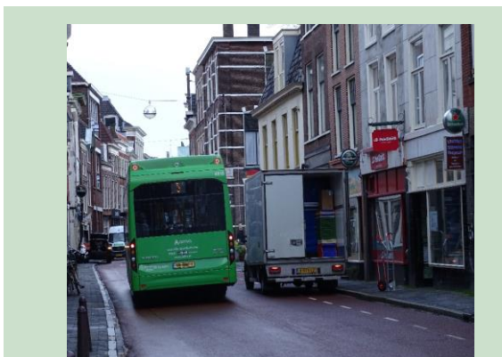
Het Noordeinde is voor de stadslijnen naar de Breestraat een omweg met veel vertragingen

Uit onderzoek is gebleken dat het invoeren van kleine bussen goed mogelijk is mits hiervoor een budget beschikbaar komt. Rover pleit van harte voor het invoeren van dit model met kleine bussen. De populariteit en de tevredenheid over het gebruik van de trein was altijd al groot, de bus heeft echter nog steeds een negatief imago, vooral bij beleidsmedewerkers van overheden en andere mensen die niet afhankelijk zijn van een bus. Kleinere bussen passen beter in de historische stad.