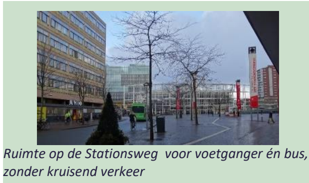
Ruimte op de Stationsweg voor voetganger én bus, zonder kruisend verkeer

In de nota wordt voorgesteld om de vervoeroplossingen van het Stadsparkerplan bij de Haagweg op grotere schaal toe te passen. Rover juicht ook dit onderdeel van harte toe. De afstand vanaf de Haagweg is met 500m naar het Kort Rapenburg te ver om te lopen.