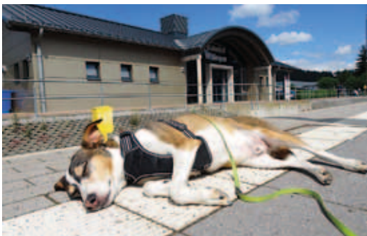
Wachten op de trein in Willingen

Zoals vaker in Duitsland krijgt de reiziger te maken met verschillende 'Tarifverbunde': een deel van het Sauerland valt binnen het Westfalentarif, een ander deel binnen de Nordhessische Verkehrsverbund (NVV). In de praktijk betekent dit een waslijst aan kaartsoorten op de kaartautomaat of in de DB Navigator app.