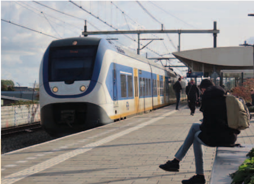
Breukelen-Amsterdam ook in het weekend vier keer per uur

Elke lijn is een intercityverbinding die twee keer per uur in een halfuurinterval rijdt. In de belangrijke overstapstations Leiden Centraal, Amsterdam Zuid en Utrecht Centraal sluiten de lijnen met dezelfde kleur op elkaar aan. Bijvoorbeeld de paarse lijnen: de IC van Alkmaar naar Maastricht sluit in Utrecht Centraal aan op de IC van Rotterdam Centraal naar Arnhem Centraal en andersom.