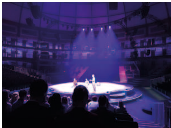
Jonge Klimaattop 2021

Inmiddels zijn er weer veel nieuwe ideeën en visies opgekomen. Een grote wens van Rover Jong is om in kaart te brengen hoe het gesteld is met de bereikbaarheid van onderwijsinstellingen in Nederland. En dan hebben we het niet alleen over campussen van universiteiten en hogescholen, maar ook over mbo's en mid-