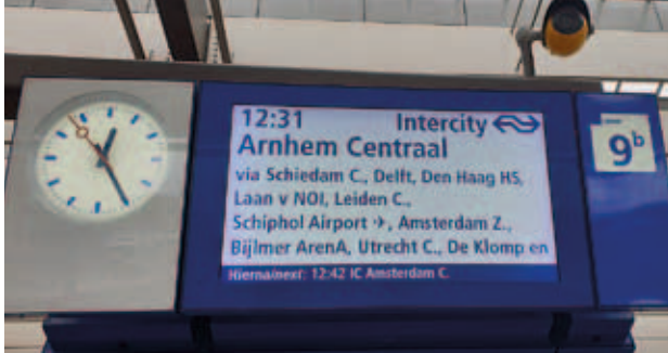
Nieuw tienminutentraject met intercity's: Rotterdam Centraal-Amsterdam Zuid