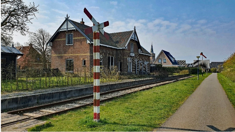
Het station aan de perronzijde, vanaf het voetpad van de Skoalstrjitte.

LA = linksaf, RA = rechtsaf, RD = rechtdoor, m = meter, ri = richting, wknp = wandelknooppunt.